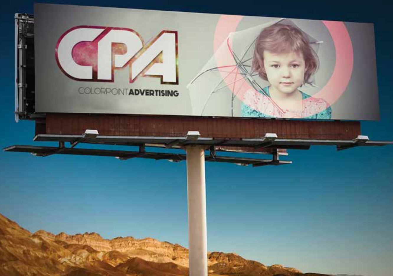
O reclamă rezistentă, imprimată digital